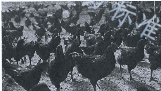
图 A. 3 和田黑鸡群体