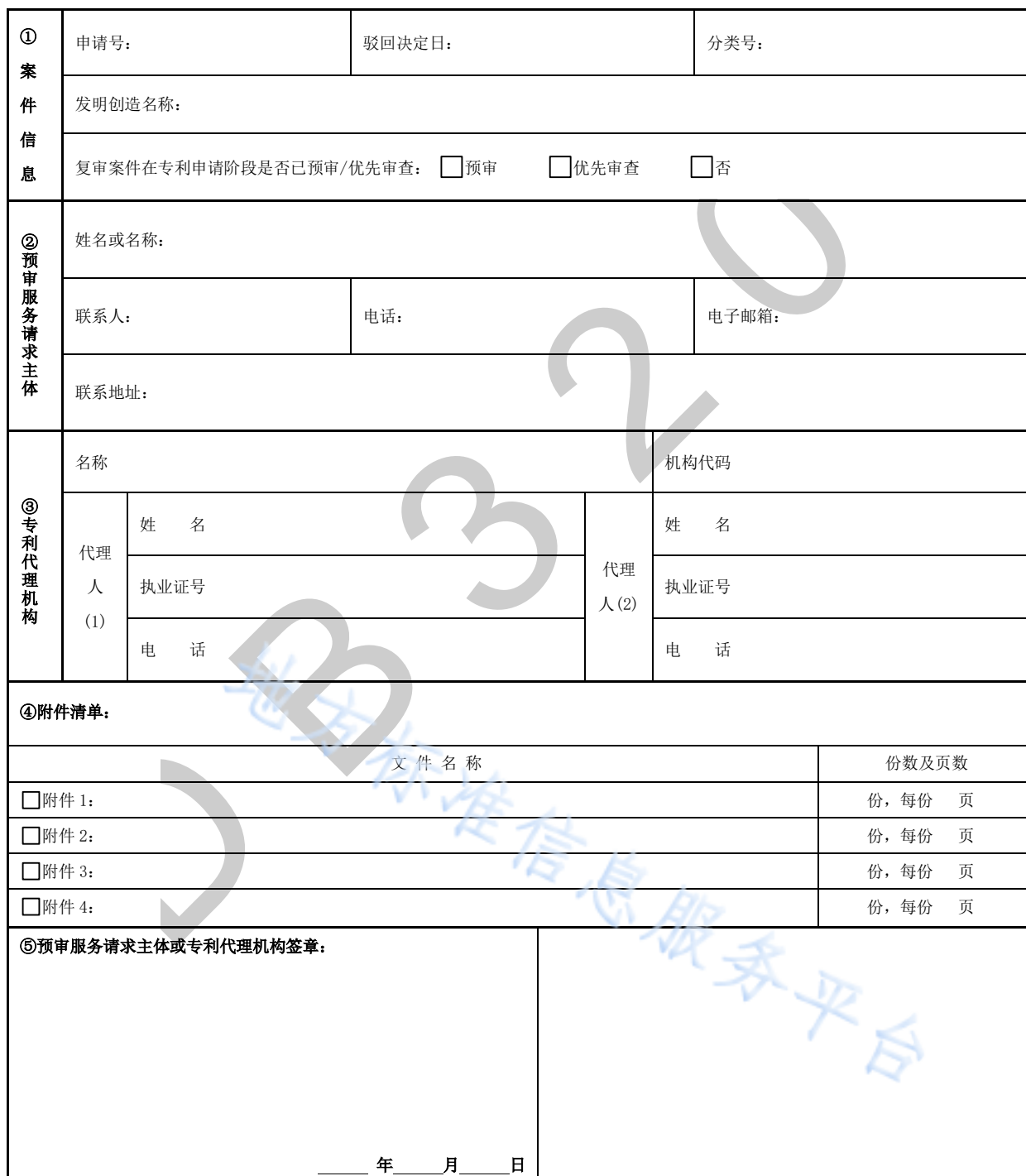
图 B.1 专利复审请求预审服务请求书格式