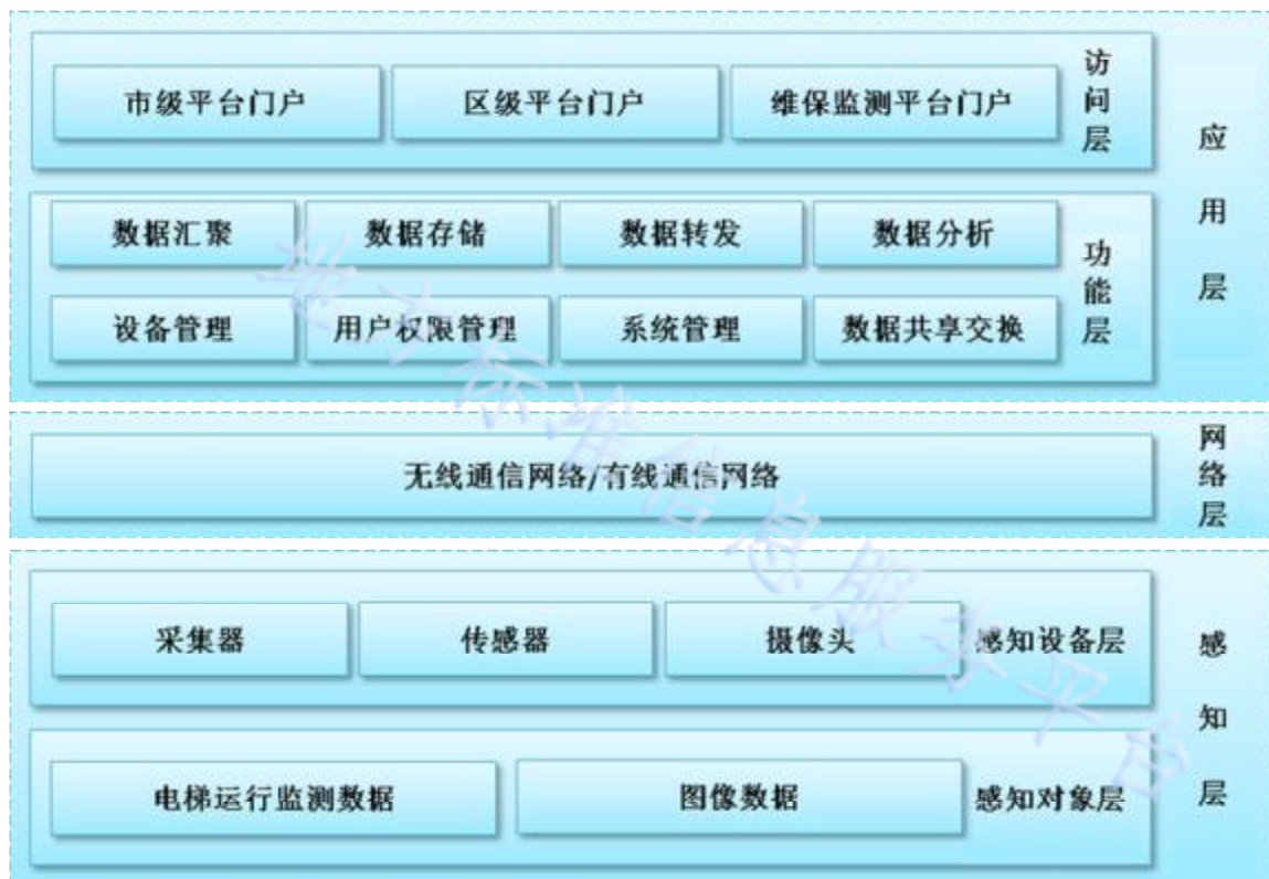
图2 电梯运行安全监测信息管理系统体系结构示意图