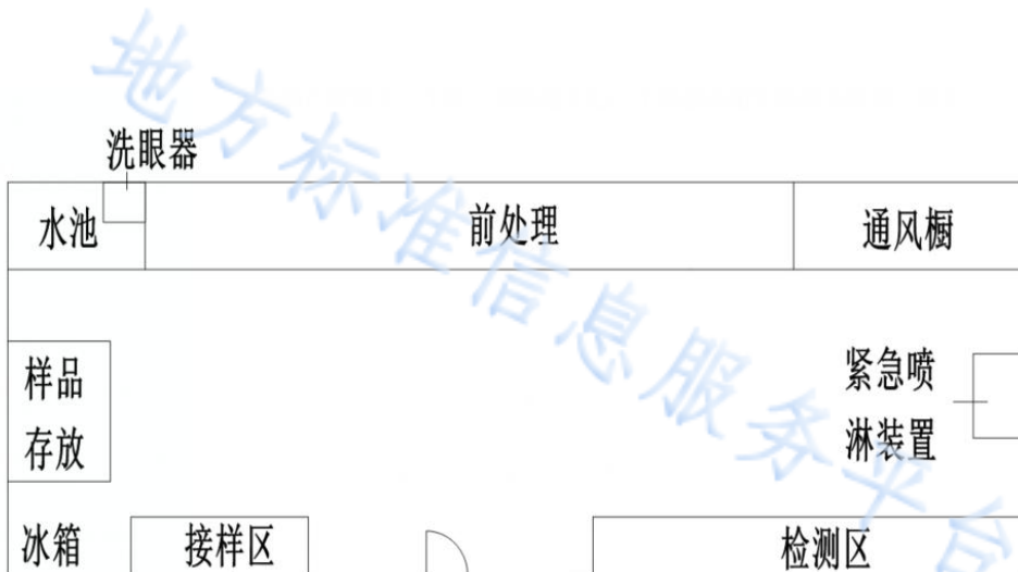
图 2. 农贸零售市场快检实验室布局参考图